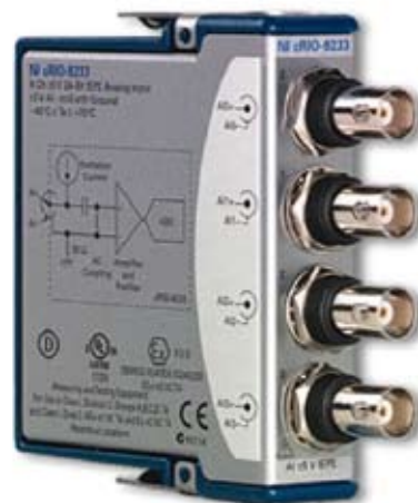
Eingangsmodul mit IEPE Unterstützung Auf Anfrage können wir noch 40 andere Module aus dieser Palette zur Verfügung stellen.