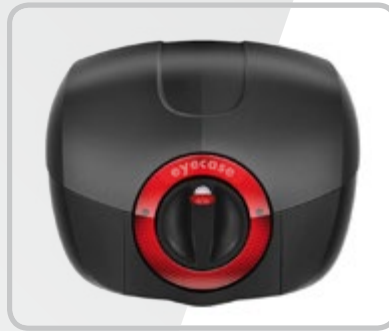
B&R - Topcase